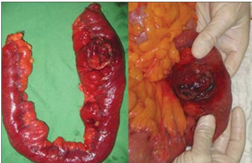
Figura 2. Imagens da peça cirúrgica: divertículo jejunal complicado com diverticulite, evidenciando-se processo inflamatório e perfuração bloqueada.

da impregnação pelo meio de contraste), com distensão e edema dos tecidos adjacentes (densificação da fásia e gordura mesentérica) (4,6,7) . Os achados de imagem do caso aqui relatado são os mesmos descritos na literatura, sendo considerados como típicos por muitos autores (5,7,10) .