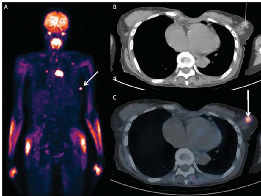
Figura 3. PET/CT revelando concentração anômala do ^{18}\text{F} -FDG no nódulo na mama esquerda (seta) com SUV máximo de 4,90 e ainda em outros sítios extramamários. A: Imagem metabólica de corpo inteiro. B: CT axial no nível do nódulo mamário. C: Fusão PET/CT axial no nível do nódulo mamário.

em pacientes com câncer de ovário, inclusive nos casos de recorrência, e alterar o tratamento. Seu valor preditivo positivo é de 89–98% para casos de recorrência de câncer ovariano, sendo mais sensível para detectar lesões extrapélvicas (8) . Contudo,